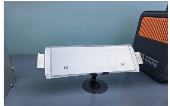
EVE에너지의 파우치형 반고체 배터리

또한, 중국 Top5 배터리 기업 EVE에너지는 안전성이 강화된 프리미엄 배터리 5 로서 반고체 배터리를 개발하고 있다. 발표된 반고체 배터리 사양은 350Wh/kg으로 현재의 LiB보다 높지만, EVE에너지는 에너지밀도보다는 외부 충격에 약하다는 평가를 받아왔던 파우치형 배터리의 안전성이 개선된 점을 주요 효과로 내세우고 있다. 다른 중국 Top5 배터리 기업인 CALB, Sunwoda 역시 반고체 배터리를 파우치형으로 개발 중이다.