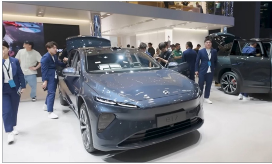
지난 4월 북경모터쇼에 전시된 Nio의 ET7. 동 모델에 반고체 배터리가 탑재될 예정이다.

공개된 응축배터리의 에너지밀도는 500Wh/kg에 달하여 기존 LiB의 이론적 한계로 여겨지던 350Wh/kg을 크게 상회하는 수준인데, 이는 리튬메탈 음극을 적용하여 구현할 수 있다는 설명이었다. 이 회사는 중국 국유 상용항공기 제조사와 협력 하에 항공기용 응축배터리를 개발 중인데, 이미 2023년 상해모터쇼에서 전기차용 응축배터리도 개발할 계획임을 발표했다. 4