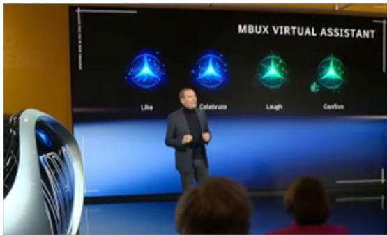
가상 Assistant 기능이 탑재된 메르세데스 벤츠의 운영체제

이처럼 다투는 두 진영이 올해 CES에서는 GenAI에 대해서도 공통의 관심을 보여주었다. 오히려 자동차 기업들이 전자 기업들보다 GenAI에 적극적인 모습을 보였다. 운전으로 인해 사용자 행동 제약이 큰 자동차 환경에서 음성 UI 및 Voice Agent에 대한 고객 니즈가 매우 크기 때문이다. 메르세데스 벤츠는 구글과 협력하여 '25년부터