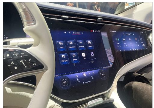
조수석까지 확장된 'Pillar-to-Pillar' 디스플레이

디스플레이 기업들도 SDV를 화두로 내걸었다. 자동차에 더 크고, 더 많은 디스플레이를 탑재해야 하는 이유를 SDV에서 찾는 분위기다. 당초 자동차 OEM들은 운전 집중해야 하는 환경 특성 상 물리적인 버튼이 바람직한 자동차 UI라고 생각했다. 하지만 내비게이션이 확산되면서 디스플레이를 탑재하기 시작했고, 이제는 계기판과 조수석까지 디스플레이로 뒤덮는 소위 'Pillar-to-Pillar' 디스플레이가 등장하기에 이르렀다. 차량 내 디스플레이 확대는 자동차가 하드웨어 중심에서 소프트웨어 중심으로 얼마나 바뀌고 있는지를 보여주는 가늠자 역할을 하는 셈이다.